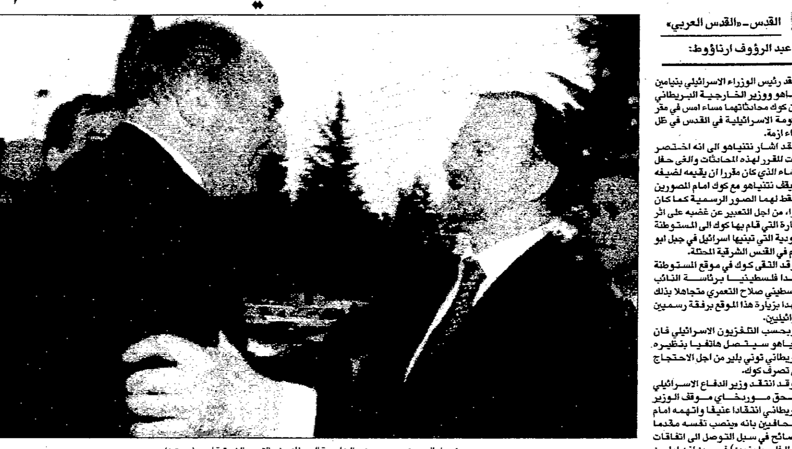
فيصل الحسيني يرحب بوزير الخارجية البريطاني في القدس الشرقية

وقد اتفق وزير الخارجية البريطاني دوجلاس هوج مع وزير الخارجية الفلسطيني ياسر عرفات على ان يلقى العشاء الذي كان مقررا ان يقامه لضيافة هوج في القدس الشرقية في جبل ابو غنيم مع وزير الخارجية الفلسطيني ياسر عرفات. وقال هوج ان هذا اللقاء كان مفاجئا له. وقد اتفق وزير الخارجية البريطاني دوجلاس هوج مع وزير الخارجية الفلسطيني ياسر عرفات على ان يلقى العشاء الذي كان مقررا ان يقامه لضيافة هوج في القدس الشرقية في جبل ابو غنيم مع وزير الخارجية الفلسطيني ياسر عرفات. وقال هوج ان هذا اللقاء كان مفاجئا له.